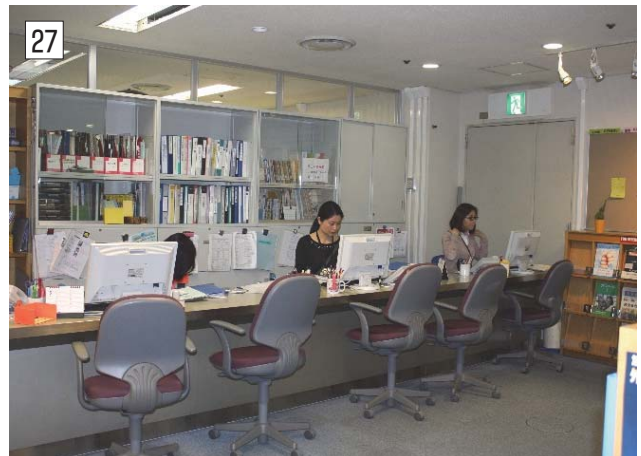
26~27 インフォメーションセンター