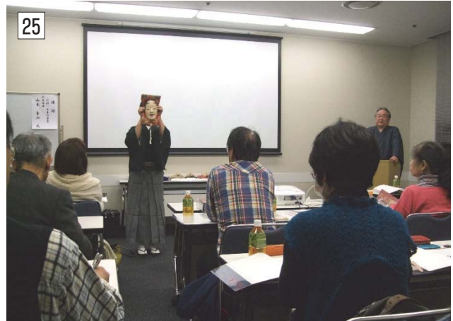
22 ワン・ワールドフェスティバル for Youth